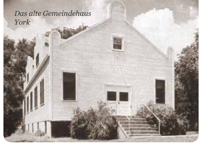
Das alte Gemeindehaus York