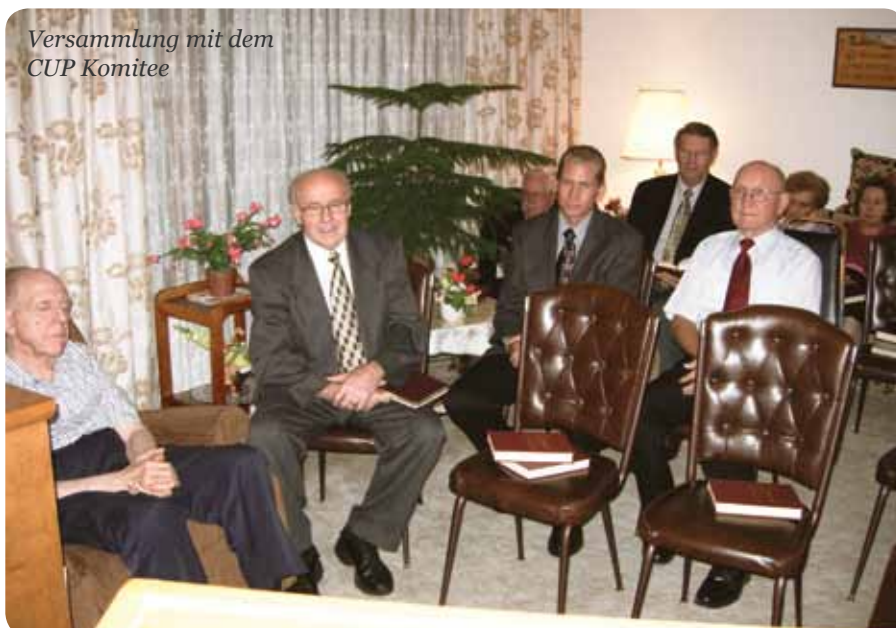
Versammlung mit dem CUP Komitee