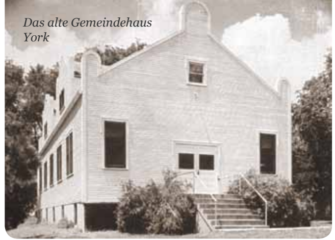
Das alte Gemeindehaus York